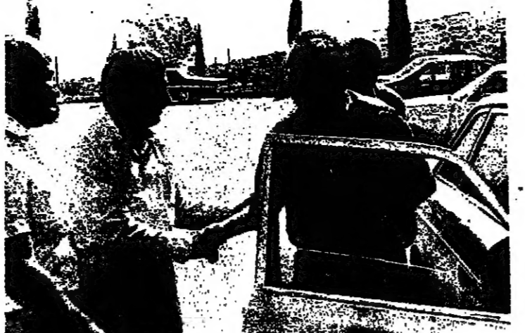
السيد يسرايل كاتسي وزير العمل والزراعة الاجتماعي أثناء زيارته لمصنع غيبور في يركا ... وصباح السيد قاسم قسماي مدير مصنع غيبور

الطاسة من قسماي وينطونات وجوارب وتصنيع المواد الخام من القماش والتطريز والخياطة هون اختصاص المرأة ، لقد تأسس المختصون بيجاد عمل للنفيات في القرية العربية لتشييد أول مصنع لمنتجات النسائية في يركا ، ولرعاية المستوي الاقتصادي ثانيا ، لذا قامت وزارة التجارة والصناعة وبالتعاون مع وزارة العمل والزراعة الاجتماعي بعض المصانع والمشاغل والورش البسيطة في هذه القرى وفي فروع المصانع غيبور لتصنيع الجوارب النسائية واحداها مصنع غيبور في يركا .